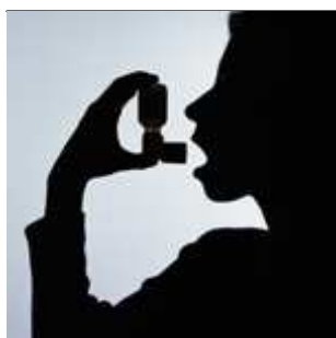
Gli steroidi inalatori nella BPCO

I principi generali rimangono gli stessi, ma l' applicazione pratica e' subordinata ad una serie di circostanze particolari. Lo spartiacque sembra essere l' avvalersi di personale genericamente dipendente. Una rassegna commentata